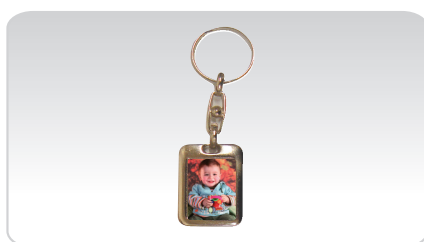
PORTA-CHAVES REF. 612

Área de impressão: 2,6 x 2 cm Impressão dupla face Inclui estojo Autocolante de resina opcional