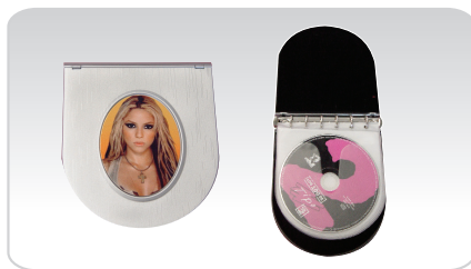
PORTA CD METÁLICO REF. 585