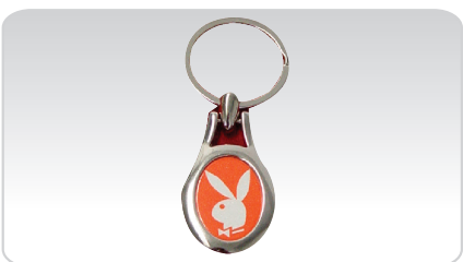
PORTA-CHAVES REF. 575

Área de impressão: 3 x 2,1 cm Inclui estojo