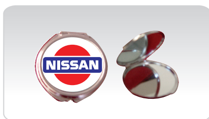
KIT ESPELHO DUPLO REF. 584