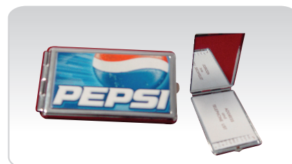
KIT ESPELHO COM AGENDA TELEFÓNICA REF. 583

Área de impressão: 2,6 x 2 cm Impressão dupla face Inclui estojo Autocolante de resina opcional